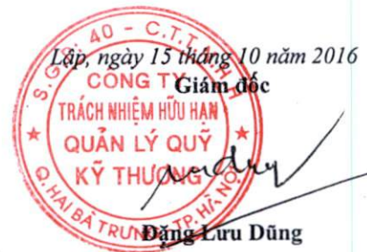
Đặng Lưu Dũng