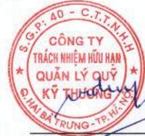
Ông Đặng Lưu Dũng